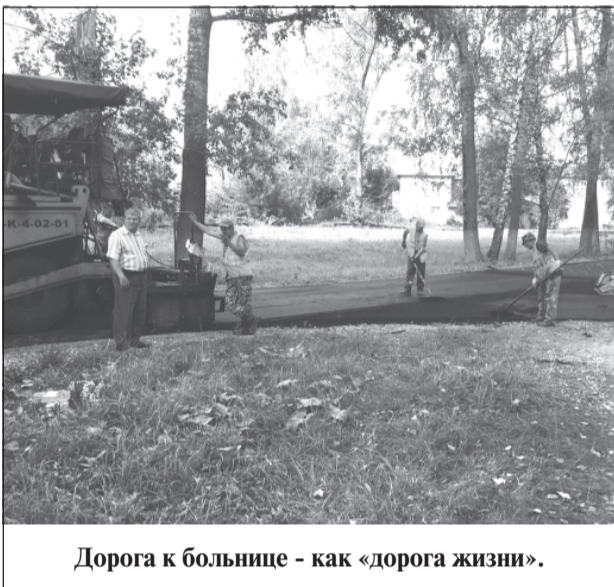
Дорога к больнице - как «дорога жизни».

На прошлой неделе завершён ремонт подъездного пути к приволжской центральной районной больнице.