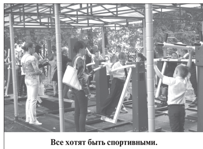
Все хотят быть спортивными.