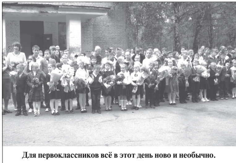
Для первоклассников всё в этот день ново и необычно.