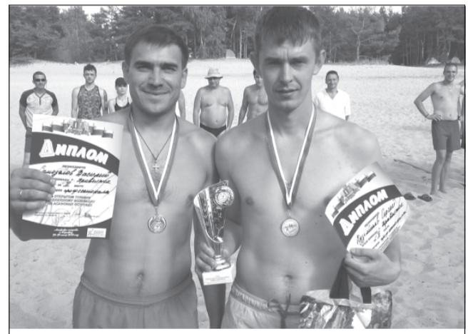
Спортсмены, показавшие лучший результат.

Соревнования по пляжному волейболу проходили недавно в Юрьевоком районе. Как обычно, проводились они по нескольким номинациям: профессионалы (мужчины и женщины), любители, МИКС и команды представителей администрации.