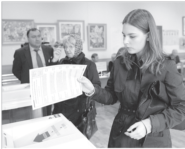
Мой выбор правильный!

В случае, если Вы в день голосования по уважительной причине (состояние здоровья, инвалидность) не сможете лично прибыть в помещение для голосования, воспользуйтесь возможностью голосования на дому. О своем решении проголосовать на дому сообщите в свою участковую избирательную комиссию письменно или устно не позднее 14.00 часов 9 сентября 2018 года. Найти контактный телефон и адрес участковой избирательной комиссии Вы можете на официальном сайте Избирательной комиссии Ивановской области.