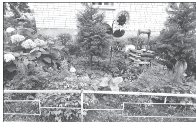
Двор, в котором приятно погулять.