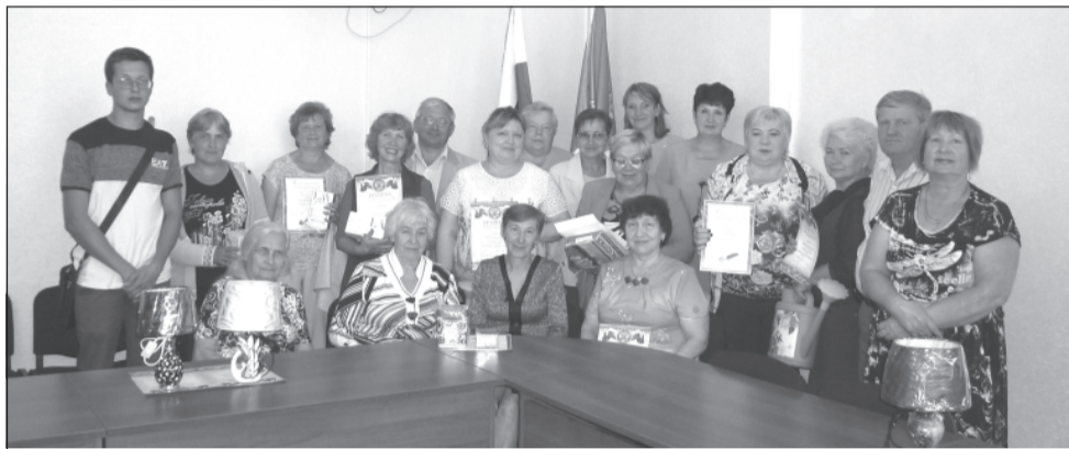
Это лишь малая часть цветоводов-любителей г. Приволжска.

Итоги конкурса «Цветущий город», которые были подведены на прошлой неделе, показали, что подобные мероприятия нужны – люди устали от машин, пыли, асфальта, скучают по цветам и деревьям, тем более, что денег зеленые насаждения требуют не так много, было бы желание ими заниматься.