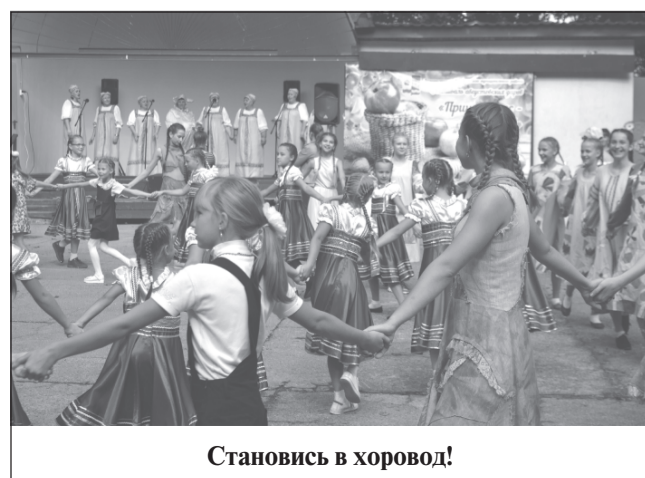
Становись в хоровод!