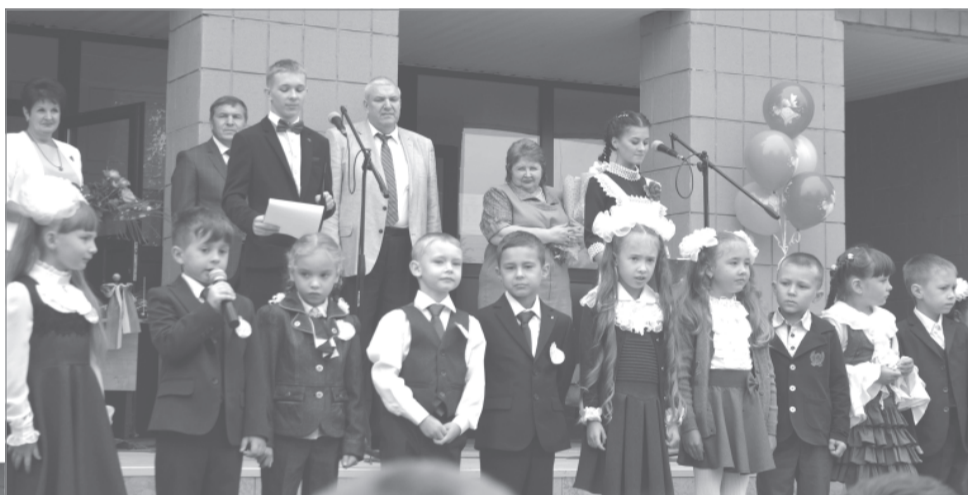
Слово первоклассников ...

Не наблюдалось изменений и в этом году, в школе № 1, всё внимание было приковано к ним: малышам - мальчикам в наглаженных костюмчиках и девочкам в аккуратных серых сарафанчиках, с огромными белыми