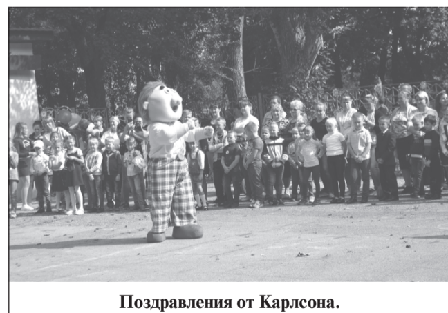
Поздравления от Карлсона.